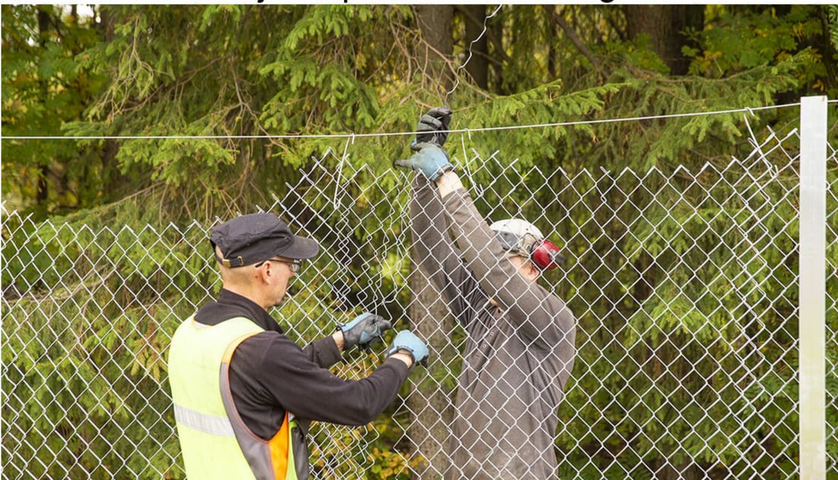
Verkon jatkamisessa tarvitaan apukäsiä, jotta toinen vetää verkon reunoja toisiinsa kiinni ja toinen pyörittää sinkilän ylhäältä alas asti.