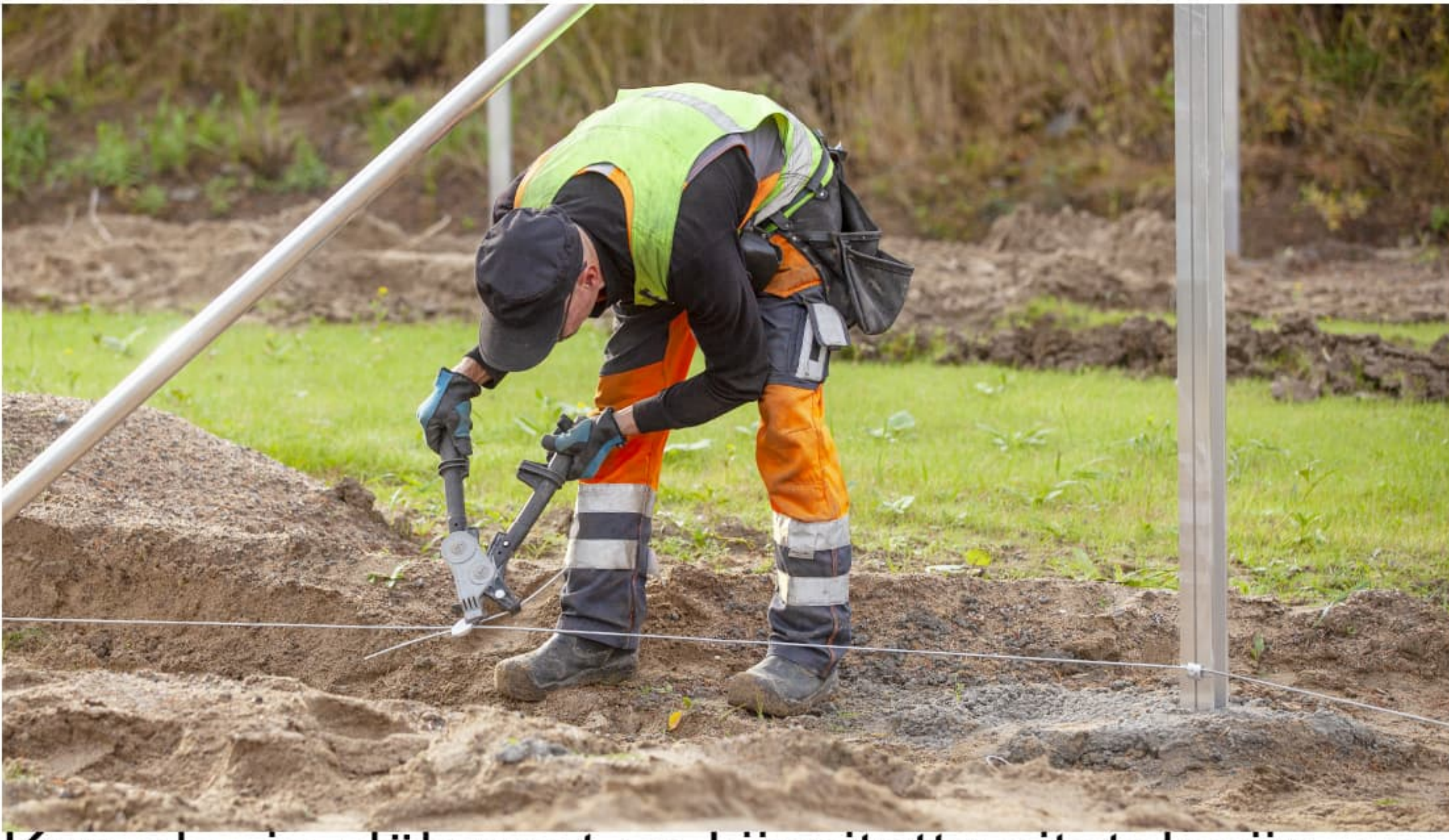
Kun ala- ja ylälangat on kiinnitetty aitatolppiin, on niiden kiristämisen vuoro.