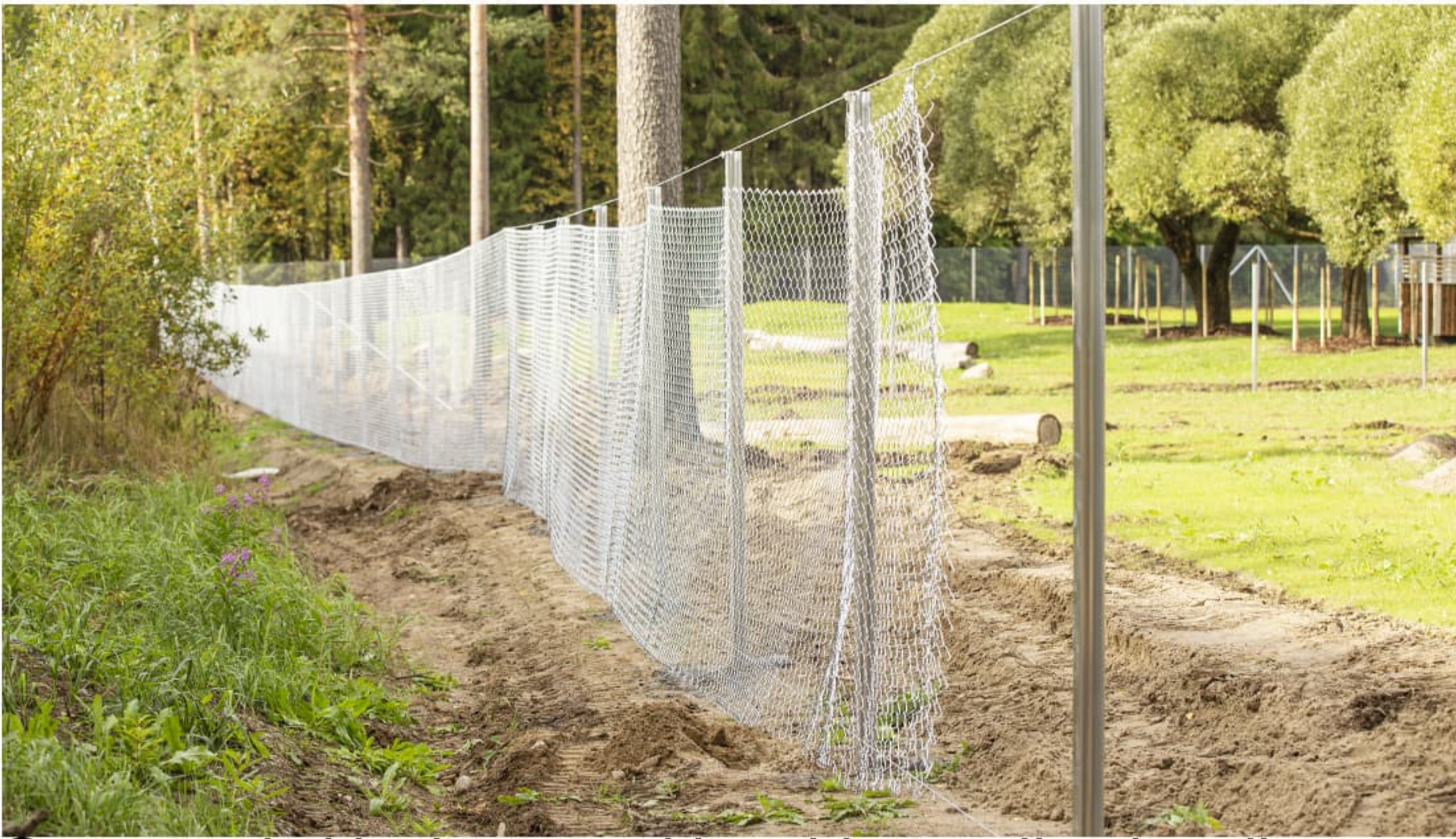
Seuraavaksi levitään verkko aidattavalle alueelle roikkumaan koukuista ylälankaan. Koukut voi tehdä esim. reunalangasta. h=2000 panssariverkkorullassa on 25m verkkoa ja se painaa noin 80 kg.