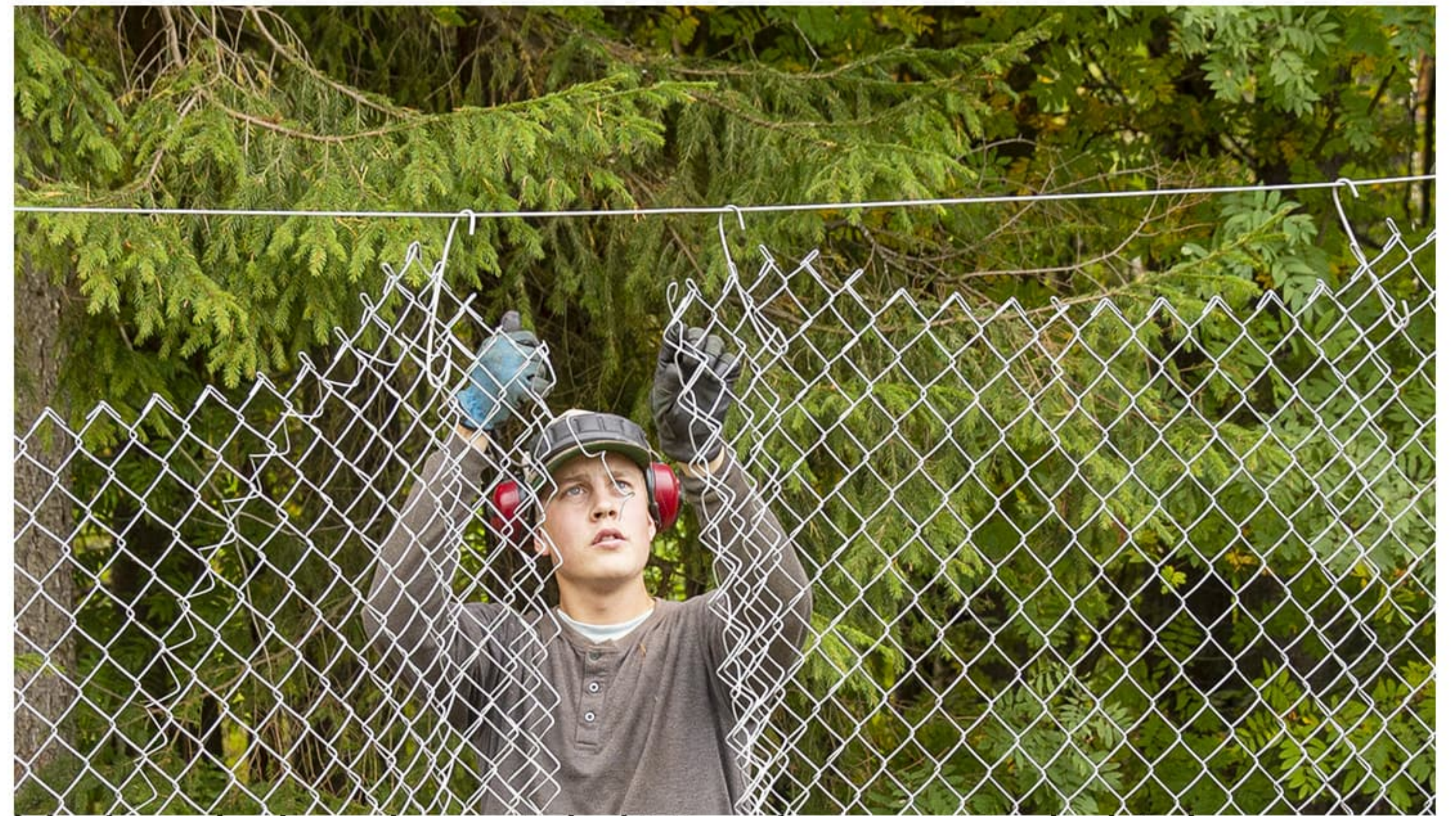
Verkon jatkaminen tehdään siten, että yksittäinen lankasinkilä pujotetaan pyörittämällä vuoroin oikean ja vuoroin vasemman puoleisen verkon läpi sitoen ne siten yhteen.