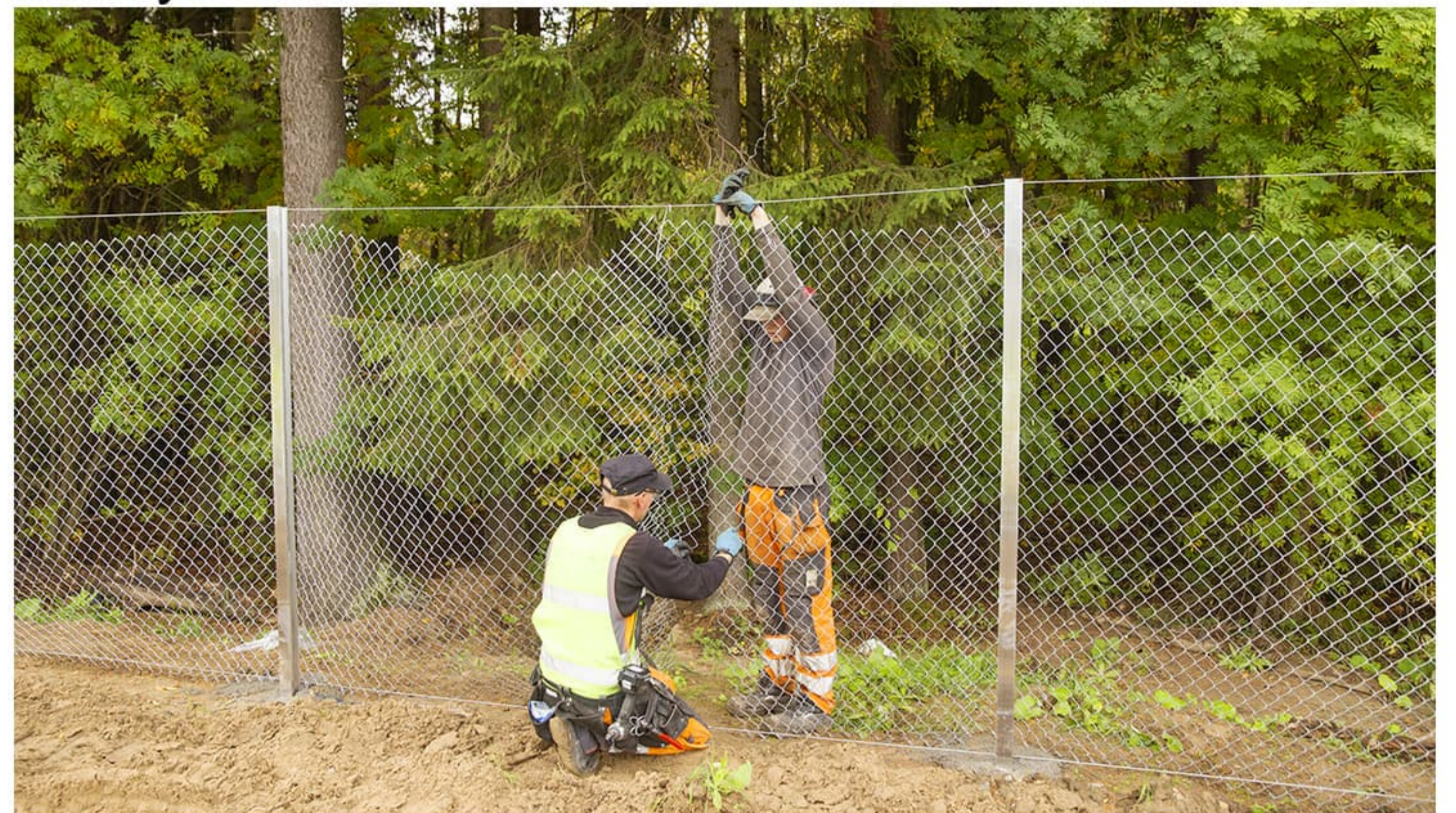
Lopputuloksena on täysi huomaamaton saumakohta. Ennen verkon kiinnitystä verkko kiristetään erittäin kireälle esim. taljan avulla.