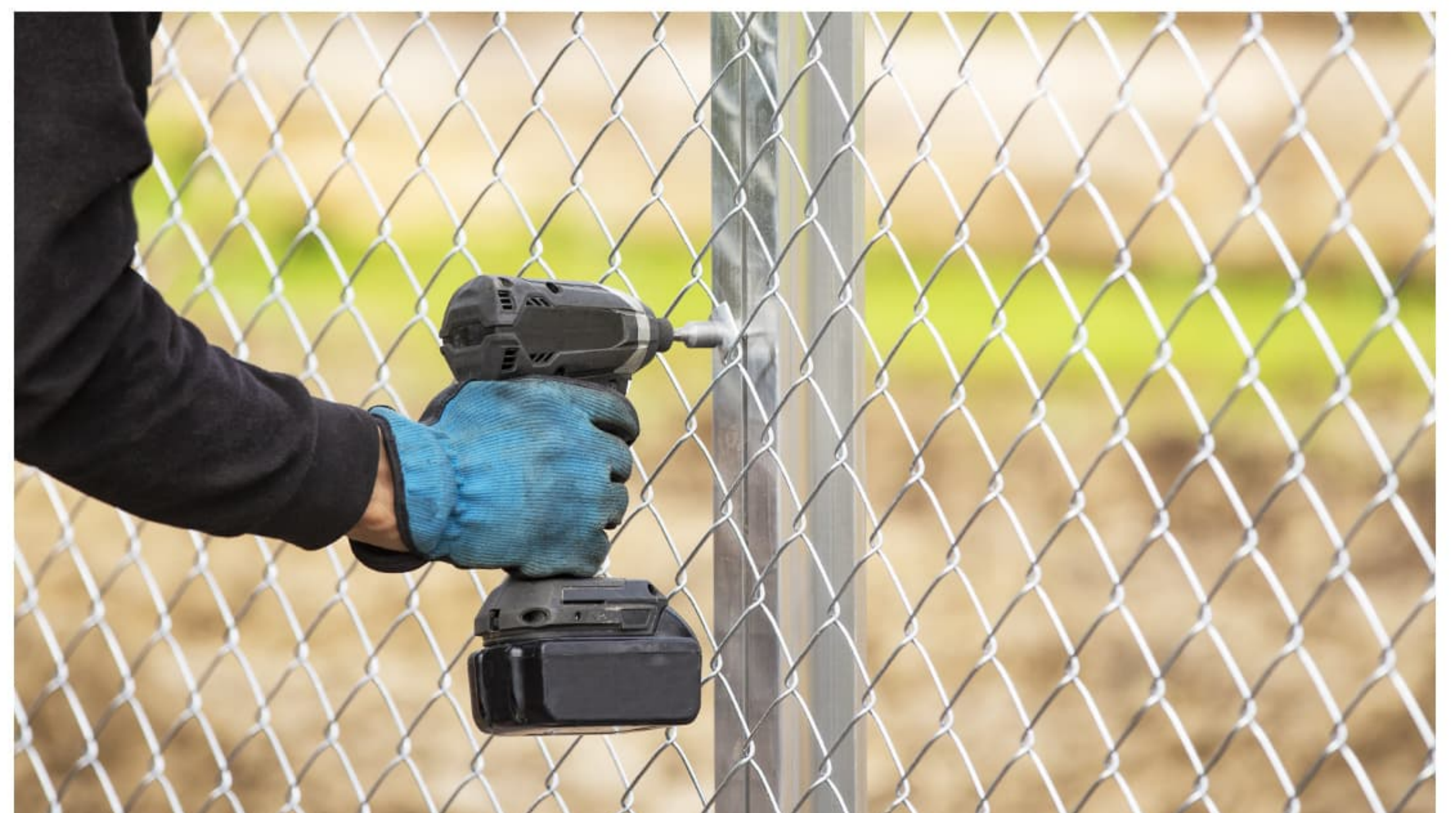
Kiinnittäminen tehdään ruuvien ja kiinnityslevyjen eli läpyköiden avulla.