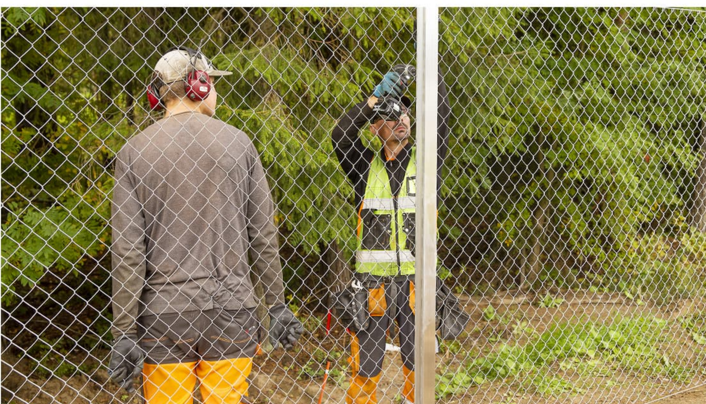
Seuraavaksi verkko kiinnitetään aitatolppiin, jolloin toinen avustaa pitämällä verkkoa oikealla korkeudella