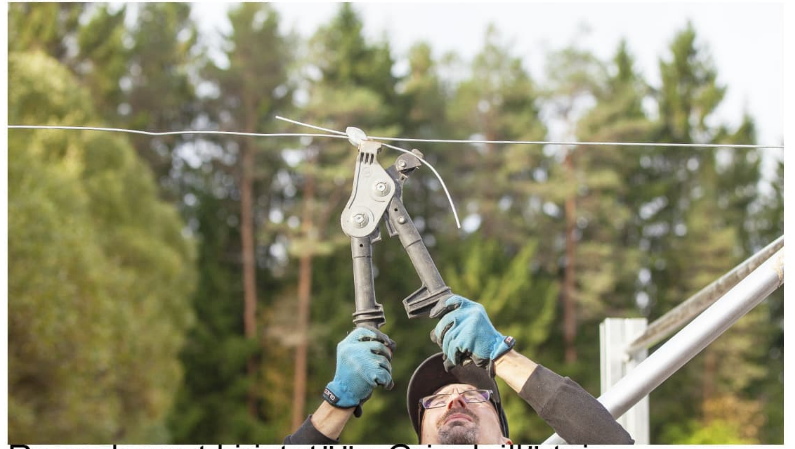
Reunalangat kiristetään Grippleillä tai räikkäkiristimellä.